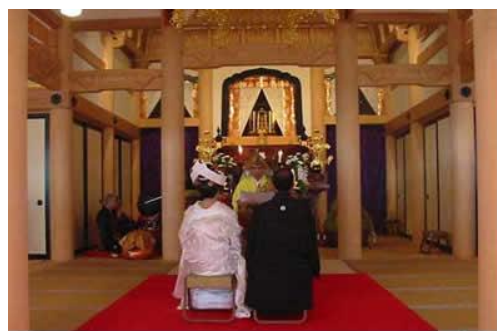
圖 7 佛前式婚禮

雖然它也是日本的傳統婚禮之一，但並不普及。目前舉辦佛前式婚禮的新人大多都是佛教的相關人士。