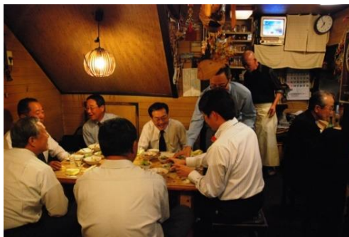
圖 3 居酒屋

在東京的新橋一帶就有很多居酒屋，只要晚上 7 點過後便可以看到穿西裝打領帶的上班族群，三三兩兩提著公事包結伴地湧進巷弄之中的居酒屋。等喝得差不多了，再搖搖晃晃、半醉半醒地搭電車回家。