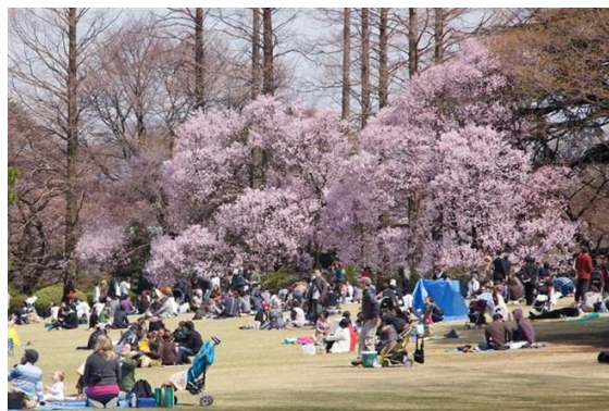
圖 4 賞櫻活動

櫻花開放時節，和家人、同事相約到公園等賞櫻場所，在櫻樹下鋪上坐墊，擺上酒宴，大家一邊觀賞櫻花，一邊吃吃喝喝，又唱又跳，熱熱鬧鬧地度過一段愉快的時光，這即是日本人民所鍾愛的賞櫻活動。