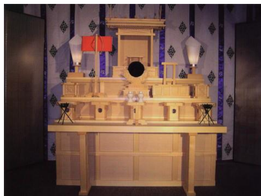
圖 8 神葬祭祭壇